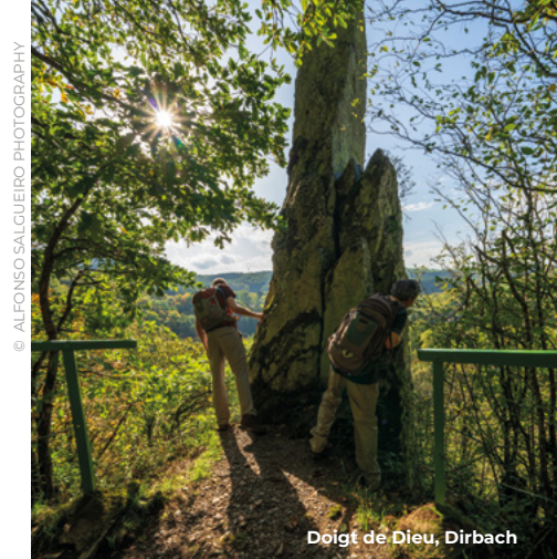
Doigt de Dieu, Dirbach

De regio telt in totaal 18 „Éislek Pied” (Éislek-paden), die deel uitmaken van de selectie van de mooiste rondwandelpaden in het Éislek. Op basis van de strenge criteria van de Europese Wandelvereniging garanderen ze de beste wandelkwaliteit.