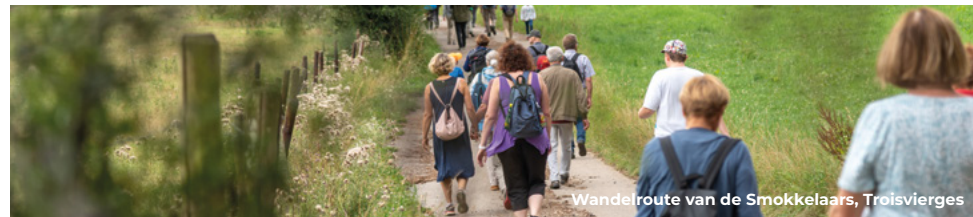
Wandelroute van de Smokkelaars, Troisvierges