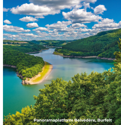
Panoramaplatform Belvédère, Burfelt

De „Summer Discovery Tours“ bieden de mogelijkheid meer te weten te komen over geologie, natuurbehoud en biodiversiteit. Een bezoek aan de beide Natuurparkcentra, een rondvaart met de solarboot of een georganiseerde wandeling in het Ourdal maken deel uit van deze „Summer Discovery Tours“.