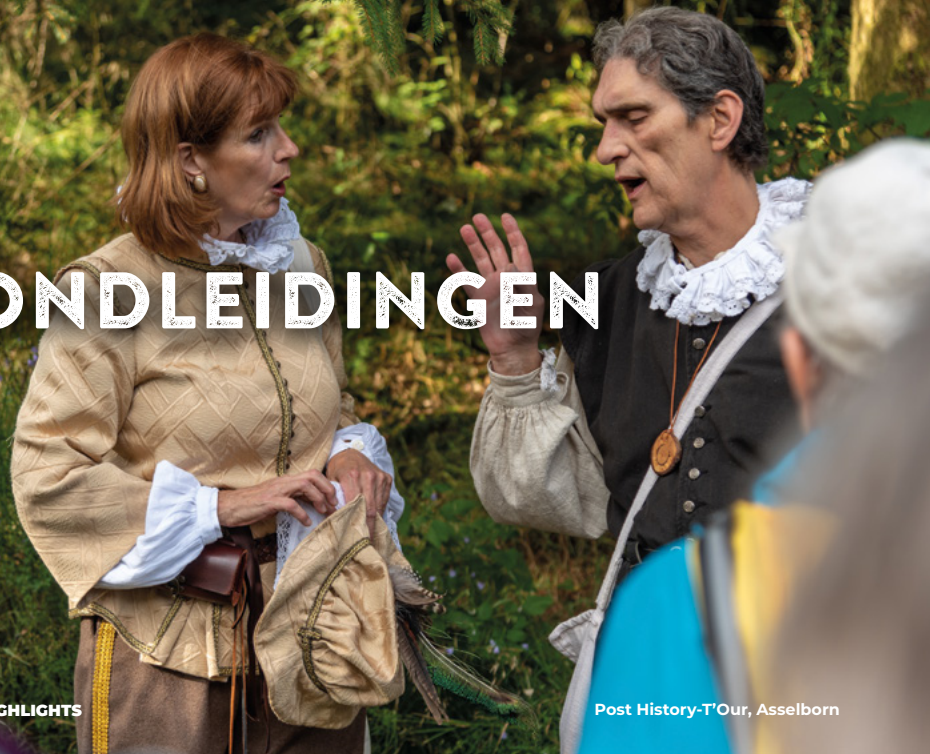
Post History-T'Our, Asselborn