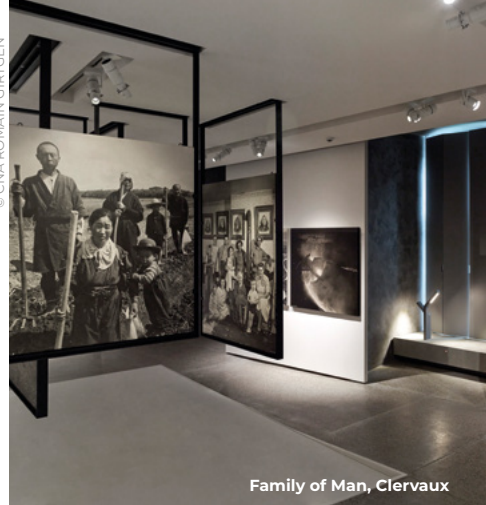
Family of Man, Clervaux

In Haut-Martelange vind je industrieel erfgoed en leer je in het museum de geschiedenis van de Éisleker leisteekennen. De eens stilgelegde kopermijn in Stolzembourg is weer open voor bezoekers. De wolfabriek in Esch-sur-Sûre is nog helemaal in oorspronkelijke staat en geeft demonstraties van de wolproductie.